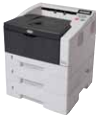
FS-1320D (acima) e FS-1370DN mostrados com dois alimentadores de papel adicionais.