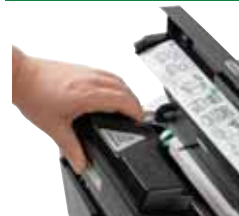
Substitua o frasco de toner de longa duração com facilidade e rapidez