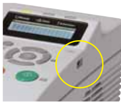
FS-1370DN: Imprima suas arquivos diretamente a partir da memória utilizando a conveniente Interface USB Host