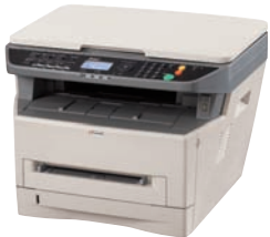
FS-1124MFP com configuração padrão 494mm P x 410mm D x 366mm A