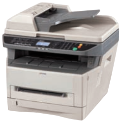
FS-1124MFP com configuração padrão 494mm P x 430mm D x 448mm A